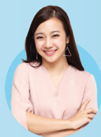
Sarah 30 Tahun

Diskon Premi untuk Tahun Pertama sebesar 5%, total Premi tahun pertama yang perlu dibayarkan (karena ikut Vitality Program): Rp 16.964.000 (Premi Dasar yang sudah didiskon) + Rp508.539 = Rp17.472.539 (Premi belum termasuk biaya keanggotaan Vitality Program)